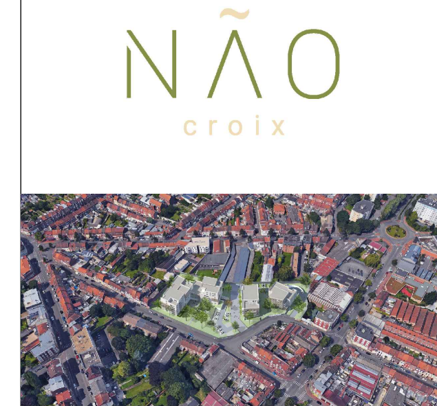
LOT A18 - BATIMENT A