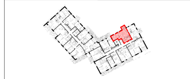
NIVEAU 01 TYPE 2