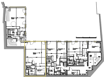
Plan premier étage