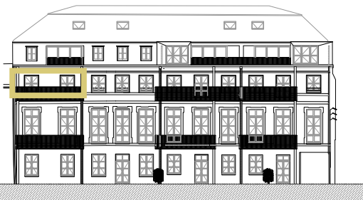
Façade sur cour