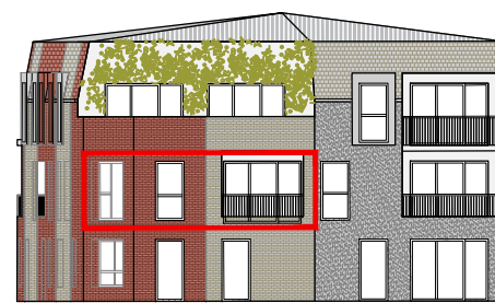
FACADE SUD - EST