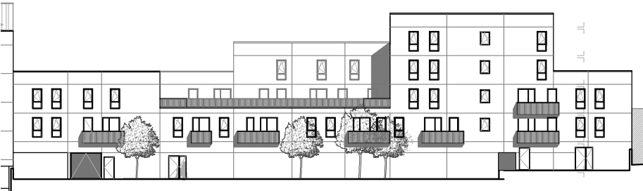
Repérage - Façade arrière