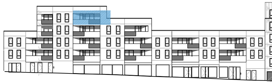
Repérage - Façade avant