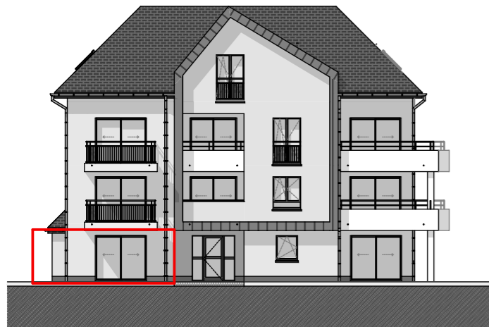
Façade Ouest / Av. René Gressier