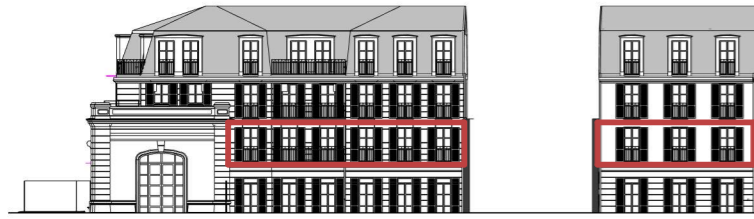
Façade de la cour OUEST