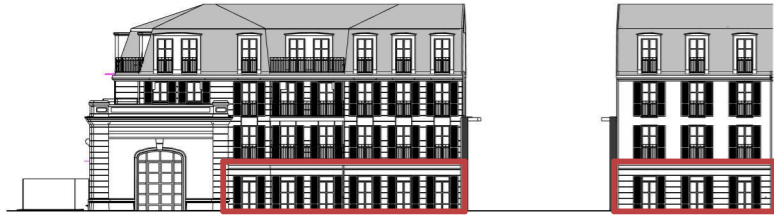
Façade de la cour OUEST